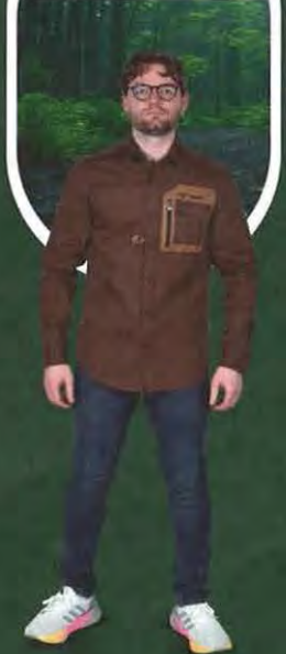
MAXIMILIAN ULBRICH OLYMPIAN

Von Wettkampfstätten bis zu Bergpfaden definiert Capapie Leistung durch Komfort und Innovation.