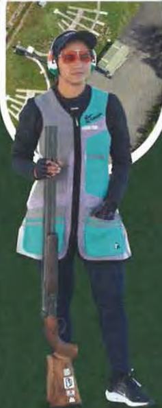
NEERU INTERNATIONAL MEDALIST