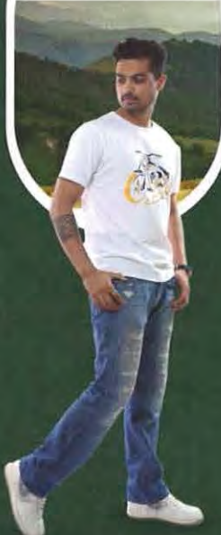
SWAPNIL KUSALE OLYMPIC BRONZE MEDALIST